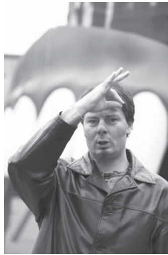
„Ich bin traurig“

Gebärdensprache im Internet: www.oeglb.at (mit einführendem Wörterbuch) www.gebaerdenwelt.at (Nachrichtenplattform) www.witaf.at