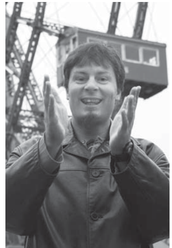
„Ich liebe dich!“